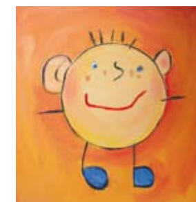
Logo Kinderarztpraxis und Wandbilder