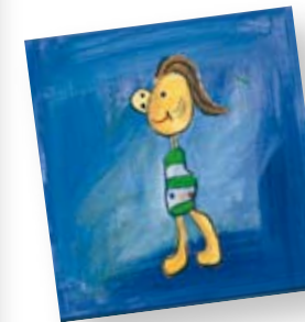
Kinderkunst von Clara und Konrad Müller

kindliche Spontaneität im Schulalter extrem abnimmt, und so bin ich froh, dass ich die besonders kreative Phase gut festgehalten habe.«