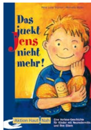
Informationsbroschüre für Kinder mit Neurodermitis